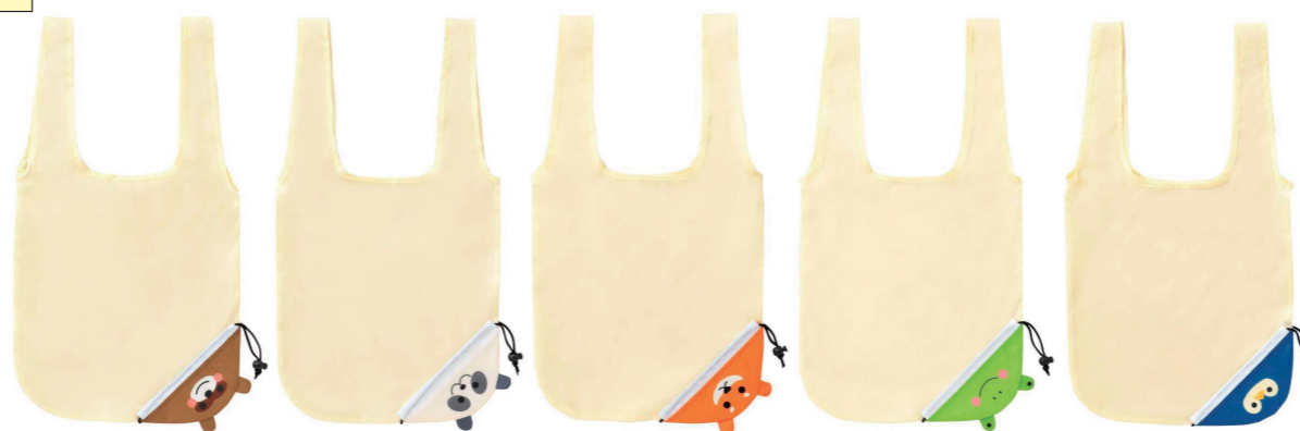
どうぶつの柄見本